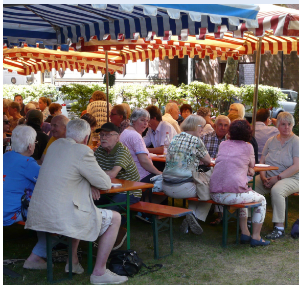
60. Erbsensuppenfest auf der Pfarrwiese

Höhepunkt war das 60. Erbsensuppenfest, zu dem die Kolpingfamilie Zentral auf der Pfarrwiese von St. Maria eingeladen hatte.