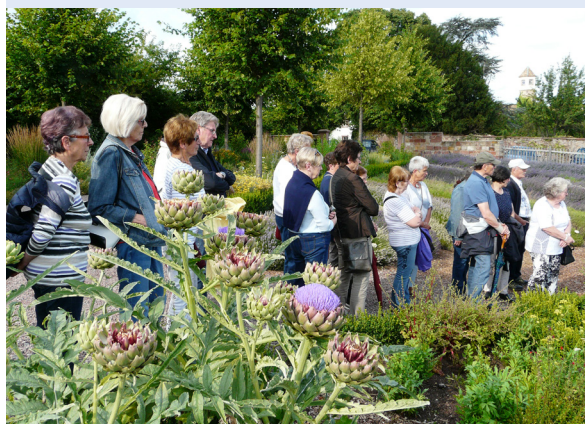
Edenkoben - Führung im Klostermühle Kräutergarten

Die Gruppe besichtigte die gotische Stiftskirche St. Ägidius in Neustadt, den Kaiserdom in Worms und den Kräutergarten der Klostermühle in Edenkoben.