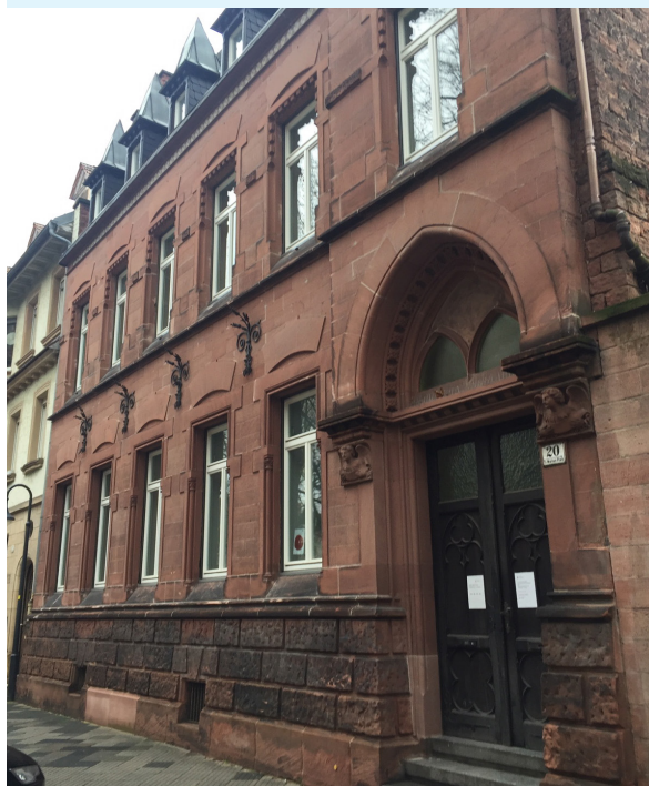
Pfarrhaus St. Maria am Marienplatz

Ende Januar wird das Pfarrbüro mit drei Sekretärinnen ins neu renovierte Pfarrhaus am Marienplatz ziehen. Im Zentralen Pfarrbüro werden alle Mitarbeiter des Seelsorgeteams ihren Arbeitsplatz haben. Anders als geplant, wurde auf die Errichtung eines eigenen Gebäudes für ein Zentrales Pfarrbüro zwischen Pfarrhaus und Gemeindezentrum aus Kostengründen verzichtet.