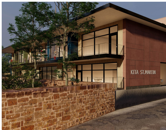
KiTa St. Martin

Sowohl in der Vorabendmesse als auch im Sonntagsgottesdienst kann sich der Pfarrer einmal monatlich eine Messe mit Gitarrenbegleitung vorstellen, in der ausschließlich Lieder aus dem Jungen Gotteslob gesungen werden. Gut angenommen werde in der Gemeinde St. Norbert in Enkenbach die von einer Band musikalisch gestaltete Sonntagsmesse.