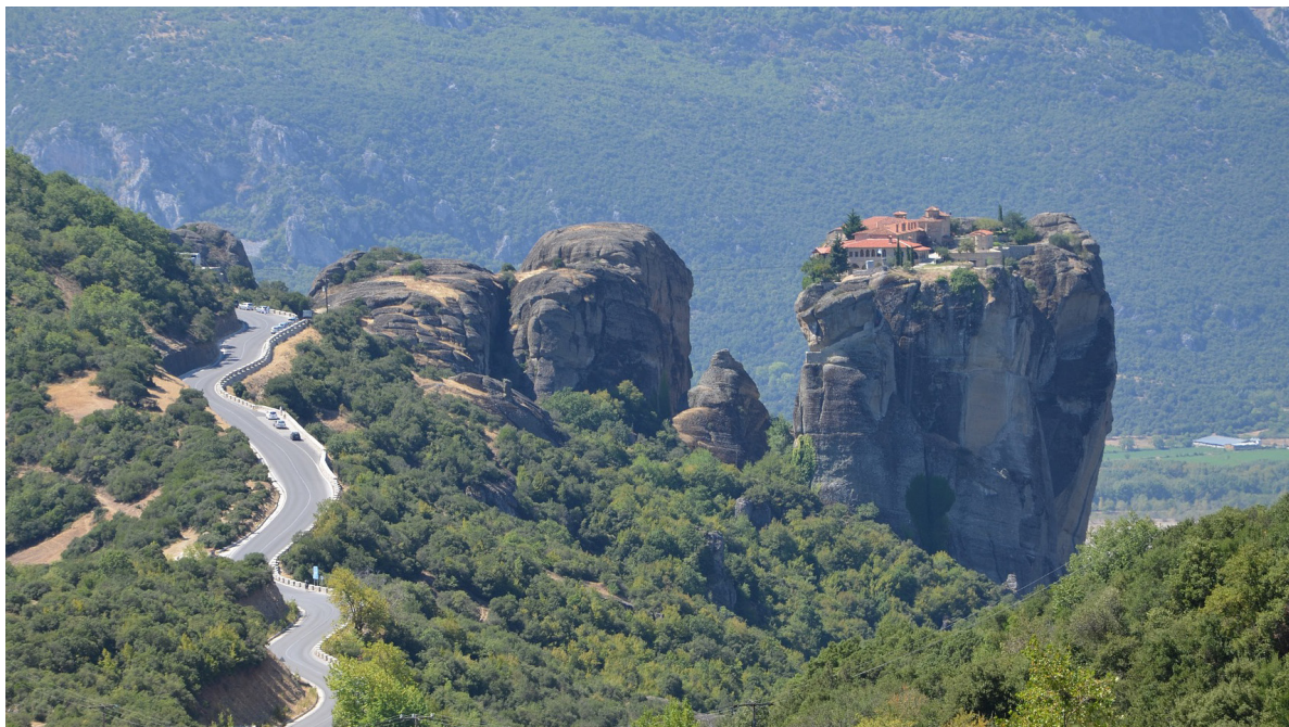
Meteora Klöster in Griechenland - Klöster in der Luft; UNESCO Welterbe