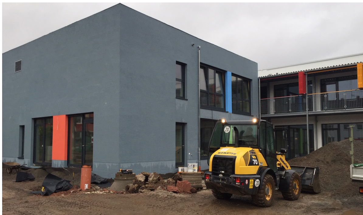
Kindergarten St. Norbert

Mit der Einrichtung eines Kolumbariums, einer Urnenbegräbnisstätte, in der Kirche Maria Schutz ist die Begleitung Trauernder zu einem Schwerpunkt der Seelsorge der Pfarrei geworden. Für Interessenten wird es weiter öffentliche Führungen im Kolumbarium geben. Für Angehörige von Verstorbenen wird es weiter ein Trauercafé und monatliche Angebote mit Konzerten, Lesungen und Vorträgen geben.